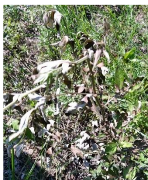
3時間後の よもぎの葉

今年8月、木曽の王滝村で開かれた研究会に参加しました。オーストラリア産、天然素材成分除草剤の試験散布が行なわれました。グリホサート主成分の除草剤に代わって使えるのではないかと期待されています。グリホサート主成分の除草剤は人体に有害だという研究が進み、使用中止を求める消費者の要請活動も盛んになっています。まず、学校や道路脇などは子どもたちにも安全な薬剤に代えていく必要があるのではないのでしょうか。