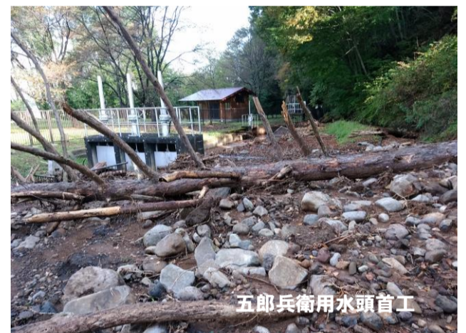
五郎兵衛用水頭首工

■佐久市議会に提出された米軍機低空飛行訓練等に関する陳情を一部変更し、全会一致で採択。情報の事前提供や市街地上空の飛行を避けるなどを要望する意見書を内閣総理大臣等へ提出しました。