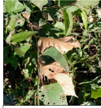
3時間では変化のなかったものも5時間後には葉の裏が茶色になっていた