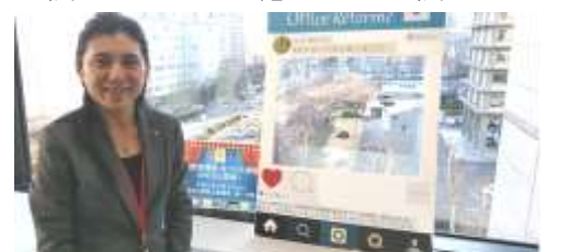
総務省行政評価局へ勉強に行きました。

佐久市の保育所・学校給食においても、限りなく安全な食材を使っていきたいと思っています。