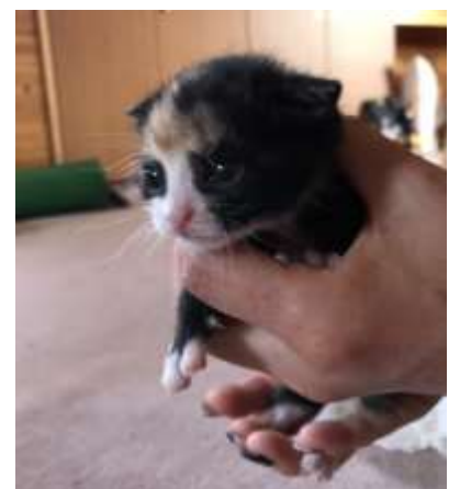
私の手の中で安心する子ネコ

そんな活動から、野良猫や増えすぎてしまった猫たちの捕獲・去勢活動をしている「そらねこ会」の方を紹介していただき、活動の様子を見せていただいたり、新しい赤ちゃん猫を預かったりしています。人間同様、夜中のミルクもあります。佐久市では猫の去勢手術に補助を出しており、ガバメントクラウドファンディング(特定の目的のためにふるさと納税の制度を使い寄付を募るもの)を行ったところ、多くの方々に賛同していただきました。動物と共存する社会に向けて、活動している方々のお手伝いが少しでもできれば、と思っています。